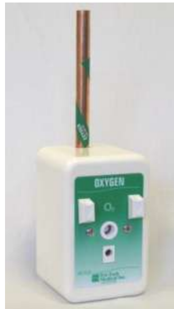
Se muestra la pieza nro. XA2124

La carcasa de montaje en superficie será de plástico durable, resistente a rayaduras. La placa de identificación y la carcasa de la salida estarán unidas al soporte de esta. El nombre del servicio de gases se mostrará en relieve de forma permanente en el cuerpo de la salida de latón cromado y su soporte. El tubo oculto de suministro de la salida será de cobre tipo K, de 7" (177,8 mm) de longitud y 1/2 (12,7 mm) de diámetro externo, etiquetado con el nombre del servicio de gases.