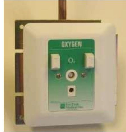
Se muestra la pieza nro. XA1124

La placa de montaje de la salida será de aluminio fundido a presión, con recubrimiento en polvo blanco, unida con la placa de identificación al conjunto oculto, y proporcionará un ajuste automático de 1/2 a 1 1/4 pulgadas (1,3 cm a 3 cm) al yeso.