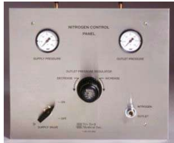
Ilustración: panel de control de nitrógeno NP100