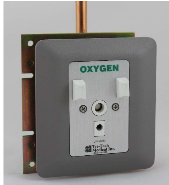
Se muestra la pieza nro. ALN91XA1124

La placa de montaje de la salida será de aluminio fundido a presión, con recubrimiento en polvo estaño, unida con la placa de identificación al conjunto oculto, y proporcionará un ajuste automático de 1/2 a 1 1/4 pulgadas (1,3 cm a 3 cm) al yeso.