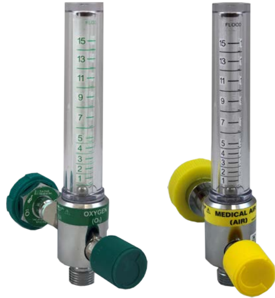
Flujómetro Oxígeno Flujómetro Aire Médico Número de pieza 57-0107 Número de pieza 57-0604