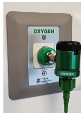
57-0127-A con 17-0486 se muestra montado en un Tri-Tech Medical Inc. salida de oxígeno